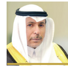
معالي / أ.د. مرعي القحطاني رئيس جامعة جازان