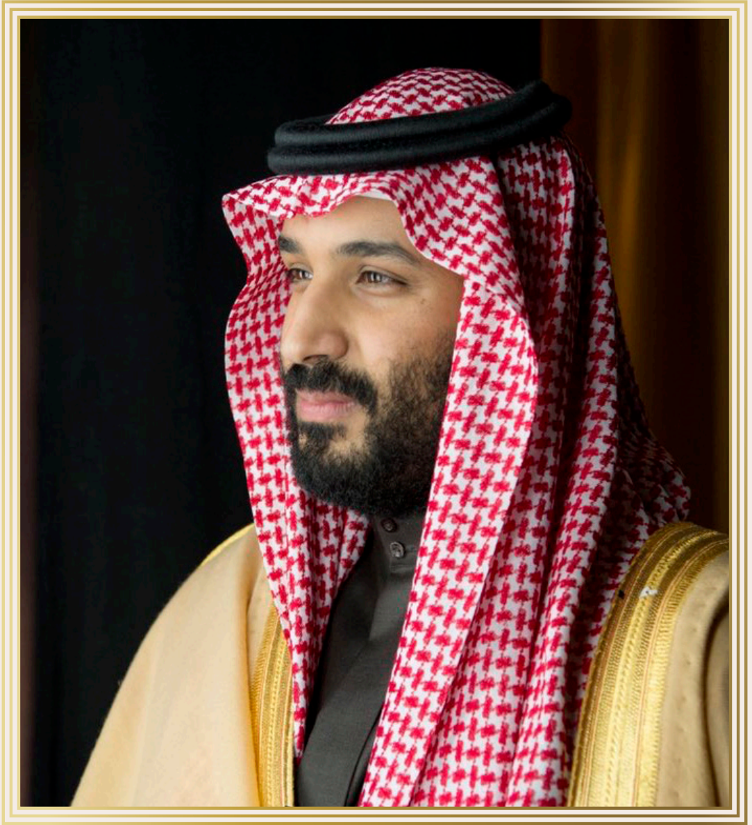
صاحب السمو الملكي: الأمير محمد بن سلمان بن عبدالعزيز آل سعود ولي العهد ورئيس مجلس الوزراء