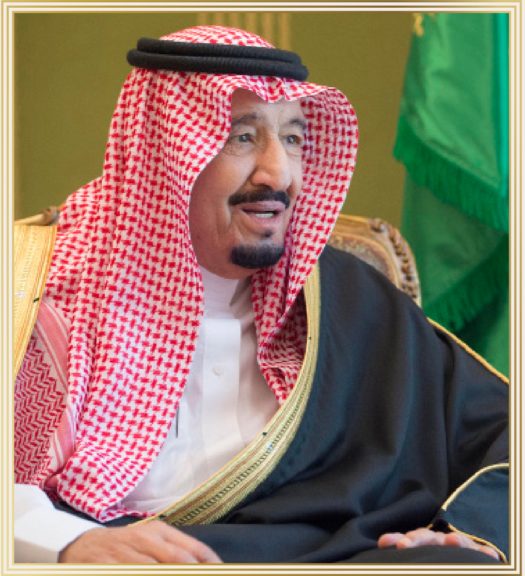
خادم الحرمين الشريفين الملك سلمان بن عبدالعزيز آل سعود (حفظه الله)